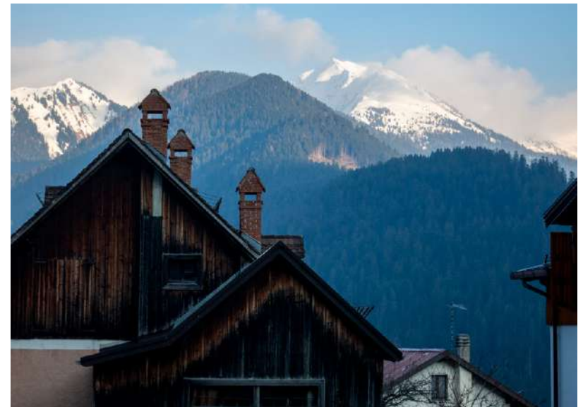
Lokalna arhitektura v sozvočju z gorami

Do Colline bomo iz osrednje Slovenije potrebovali tri ure vožnje.