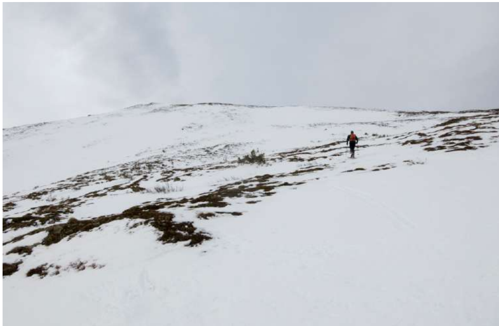
Spihani vrh Schrattner Kogla

Običajna oprema za turno smučanje, plazovni trojček (žolna, sonda, lopata)