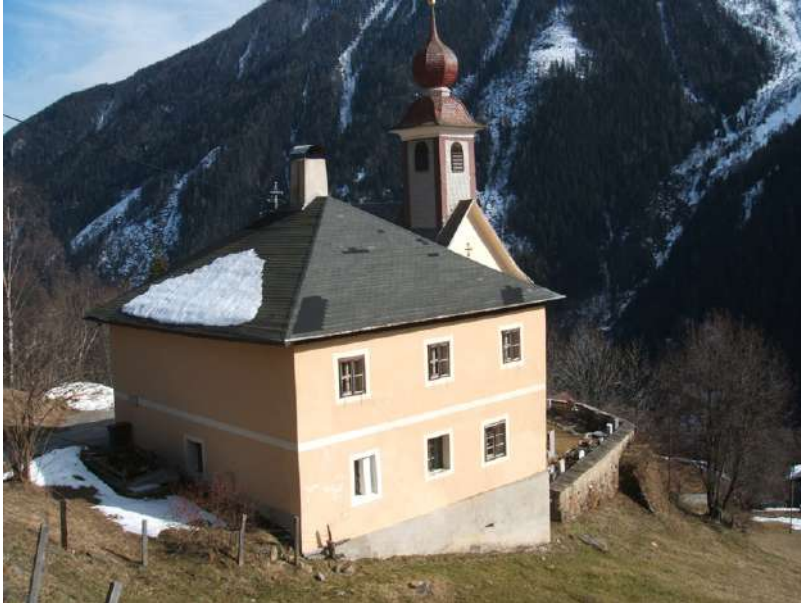
Skromna cerkvena v Teuchlu

že dolgo ne bomo naleteli. Prav na koncu Teuchla je prvinska gostilna Alpenheim z možnostjo prenočevanja, ki nam lahko služi kot naše izhodišče. Navadno je Teuchl dobro založen s snegom in je sčasoma pridobil na veljavi pri turnih smučarjih, vendar se zaradi obilice ciljev razkropijo po dolini, tako da tukaj ne povzročajo kakšne pretirane gneče.