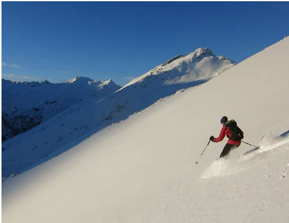
Božični pršič pri popoldanskem spustu z Wilde Mänderja

Običajna oprema za turno smučanje, plazovni trojček (žolna, sonda, lopata)