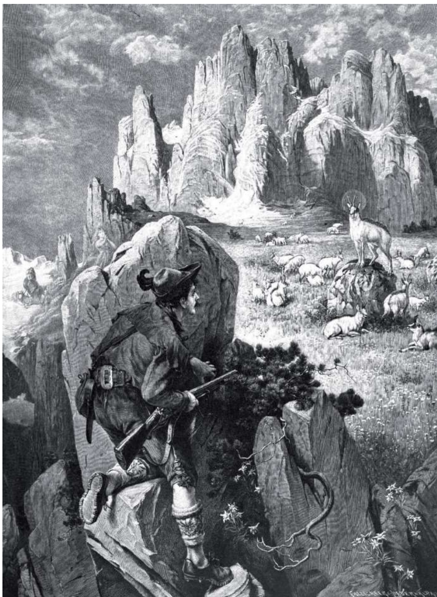
Mladi lovec se gnan od ljubezenske in lovske strasti poda v lov na bajeslovnega gamsa. Ilustracija iz leta 1899. Vir Wikipedija

uplenil bajeslovnega Zlatoroga, toda strast ga je zaslepila in ko je našel velikega gamsa z zlatimi rogovi, je streljal nanj. Pri tem je pozabil, da ima Zlatorog čudežno moč. Tam, kjer je njegova kri namočila tla, je pognala čudodelna triglavska roža. Gams jo je popasel in hipoma so se mu povrnile moči. Zagnal se je v nesrečnega lovca, ki je zaslepljen od bleska rogov (metaforično zaradi človeške sle po neizmernem bogastvu) omahnil v prepad. Našli so ga s šopkom triglavske