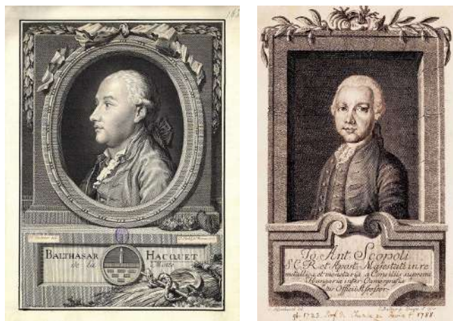
Giovanni Scopoli in Baltazar Hacquet.