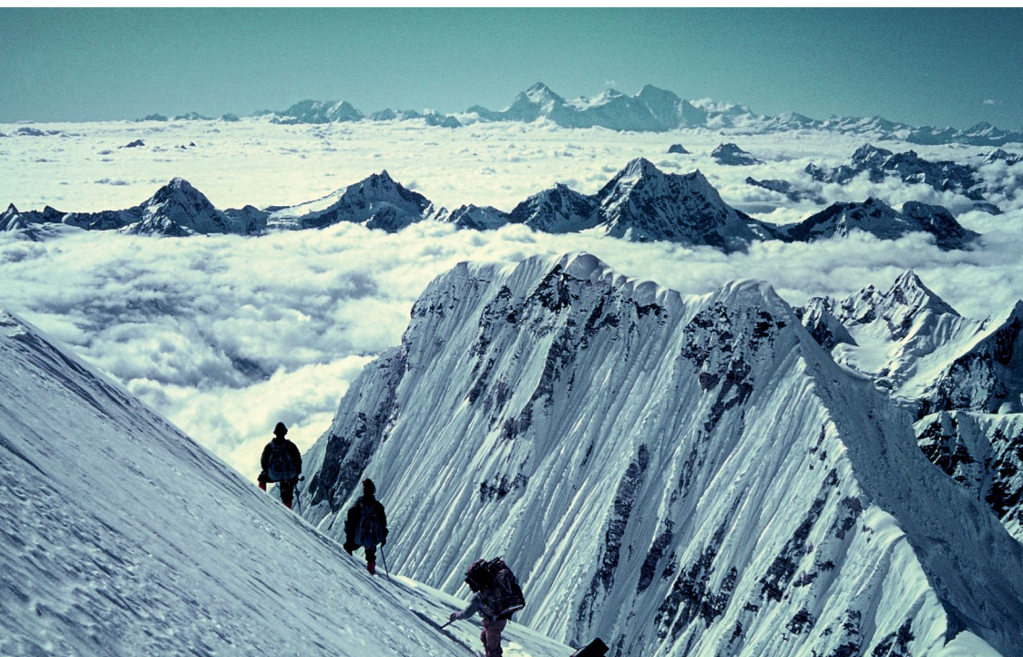
Kangbačen 1965. »Še slutil nisem, kako bo ta gora posegala v moje življenje, koliko usod se bo odvilo na njej, koliko veselja, obupa, sreče in žalosti se bo prelilo na njenih pobočjih. Takrat je bila le bleščeče bela gora, čista in prazna, čakajoča, da nanjo napišemo svojo prvo zgodbo ...« V višavah nad 7000 m seže pogled čez Beli val vse do Makaluja, Lotseja in Everesta. ATŠ